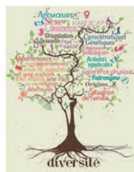
Remise du Label Diversité

Parmi les entreprises et administrations figurent notamment AXA, BNP Paribas, La Poste (2009), les ministères "économiques" (budget, finances, industrie), la Ville de Lyon, SFR, Veolia Environnement (2010), AREVA, BOUYGUES Telecom, MACIF (2011) .