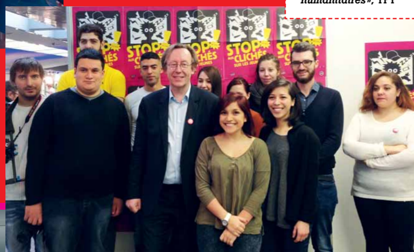
Les jeunes de Stop aux Clichés avec Jean-Patrick Gilles, député de Tours et président de l'UNML.