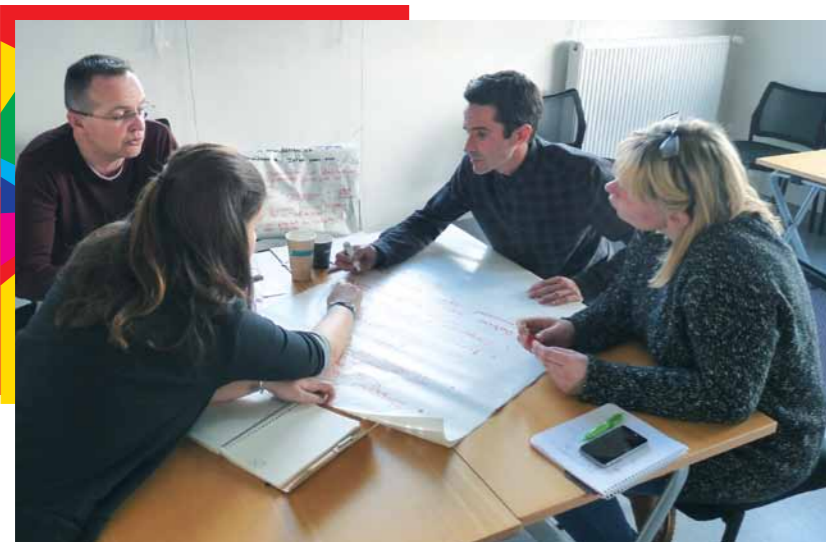
Des professionnels et des élus se sont retrouvés, tout au long de l'année pour se former et échanger. Ici, lors de la formation « S'outiller pour débattre ».

Ainsi, nous avons développé des projets d'accompagnement ou poursuivi celui des collectivités suivantes : Avignon, Cergy, Istres, Fontenay-sous-Bois, Montreuil, Paris, Saint-Denis de la Réunion, la Collectivité territoriale de Corse, les Conseils Départementaux de l'Hérault et de la Drôme... Il s'agit à chaque fois de faire un diagnostic des enjeux jeunesse du territoire et d'envisager, avec les équipes et les élus, quel type de dispositifs de participation il faudrait mettre en place pour renforcer le dialogue entre jeunes et élus, ou co-construire des actions, voir imaginer la refonte de la politique jeunesse du territoire avec les jeunes.