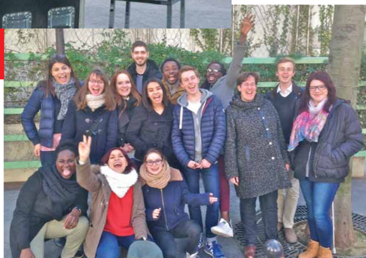
Pendant 1 an, le Comité jeunes de l'Anacej a travaillé à la préparation du Congrès.