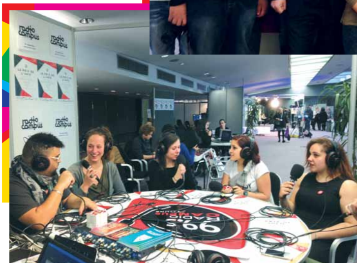
Le plateau de radio Campus France avec les jeunes de Stop aux Clichés, lors des Assises Internationales du journalisme de Tours.