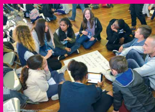
Retour sur le 11 e Congrès de l'Anacej