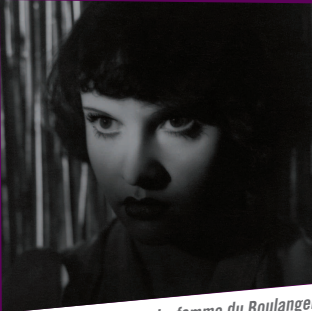
Ginette Leclerc, La femme du Boulanger , Marcel Pagnol, 1938