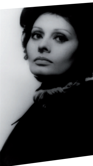
Sophia Loren, Le Verdict , André Cayatte, 1974

Exposition réalisée par le Jeu de Paume, Paris, avec le concours de la Médiathèque de l'architecture et du patrimoine, ministère de la Culture et de la Communication et en collaboration avec l'Etablissement du Château de La Buzine, Marseille.