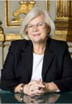
Catherine Vautrin ministre du Travail, de la Santé, des Solidarités et des Familles