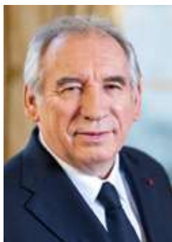
François Bayrou Premier ministre