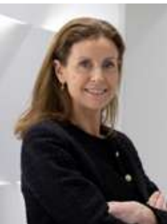
Charlotte Parmentier-Lecoq ministre déléguée chargée de l'Autonomie et du Handicap

Aujourd'hui, nous mesurons le chemin parcouru dans la reconnaissance des droits et l'inclusion, mais aussi celui qu'il nous reste à accomplir. L'inclusion des personnes en situation de handicap doit être une priorité constante, et cela passe par des actions concrètes : renforcer l'accessibilité des lieux publics et des services essentiels, simplifier les démarches administratives, assurer l'école pour tous dans les meilleures conditions et enfin, garantir un accès effectif à l'emploi comme source d'émancipation. L'événement du 11 février 2025 au Handilab est une occasion unique de rassembler les personnes concernées, les acteurs engagés et les représentants des pouvoirs publics pour faire le bilan et tracer les perspectives d'avenir dans un monde où l'innovation technologique repousse les frontières du possible. Ensemble, nous devons poursuivre cet engagement avec ambition et détermination, pour que l'inclusion ne soit plus un combat, mais une évidence dans notre société.