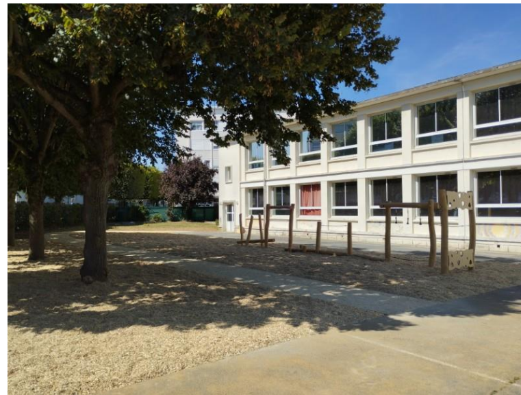
Groupes scolaire Cézanne - Cordeliers