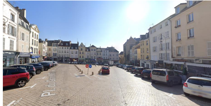
Place du Grand Martroy