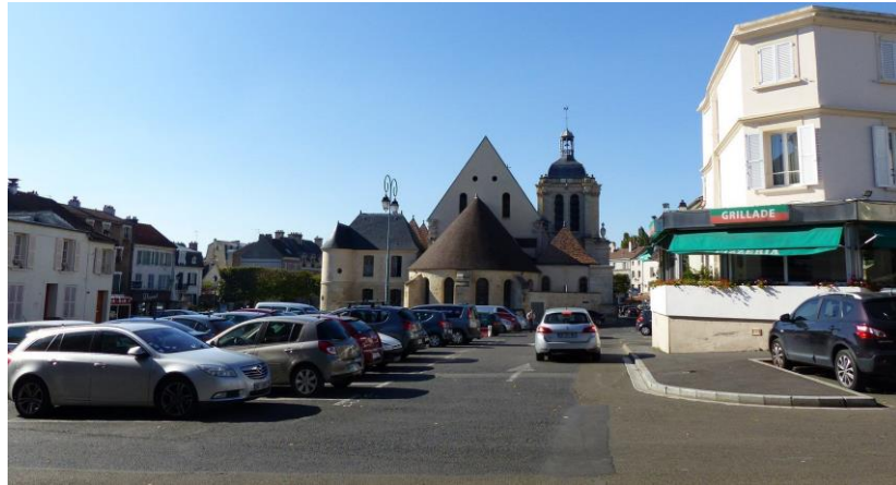
Place Notre Dame