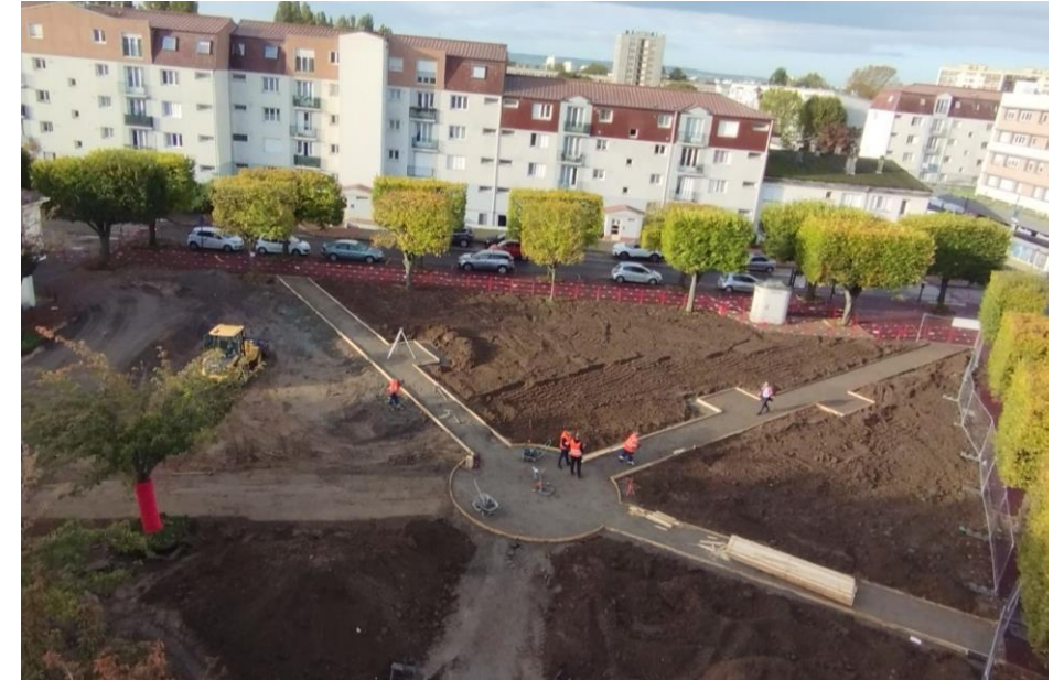
Place Van Gogh