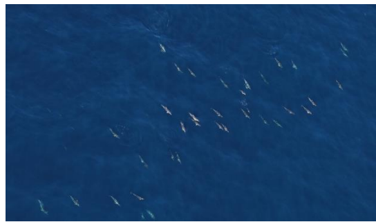
Parc de Corail & Suivi de la mégafaune marine par observation aérienne