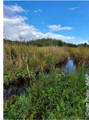
Tourbière de Vied (59)

Le PNRSE a par ailleurs accueilli en 2021, le 13ème séminaire national des gestionnaires de site RAMSAR, avec pour objectif de fédérer les acteurs locaux autour des enjeux de préservation de ces milieux naturels remarquables. Pour l'organisation de cet évènement, le PNRSE a bénéficié d'une subvention de l'Agence d'un montant de 12 873€.