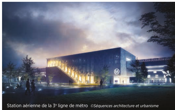
Station aérienne de la 3 e ligne de métro @Séquences architecture et urbanisme

Pôle d'échanges multimodal de Matabiau : pour répondre à la forte croissance des besoins de déplacement au sein de l'agglomération toulousaine ainsi qu'aux enjeux de décarbonation des mobilités, les partenaires du projet Grand Matabiau, quais d'Oc - Toulouse Métropole, le Département de la Haute-Garonne, la Région Occitanie, Tisséo, la SNCF, l'État, Europolia - ont souhaité engager la réalisation d'un pôle d'échanges multimodal (PEM) de nouvelle génération autour de la gare Matabiau. Ce grand projet, qui s'articule avec le développement de l'offre de transports (TER, TGV, 3 e ligne de métro), fait l'objet d'une mise en œuvre coordonnée par un collectif de maîtres d'ouvrages. Ainsi, les briques fonctionnelles de ce programme partenarial intègrent des aménagements urbains portés par Toulouse Métropole (vélostation, parvis d'accès à la gare), des aménagements de transports urbains portés par Tisséo (reconfiguration des espaces d'interconnexion entre l'environnement métro et les autres établissements), des